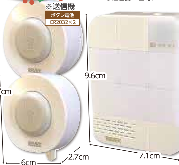
※送信機 ボタン電池 CR2032×2