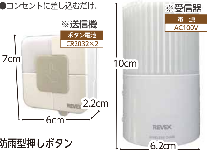
※送信機 ボタン電池 CR2032×2