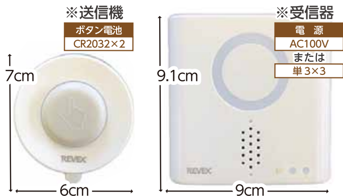
※送信機 ボタン電池 CR2032×2