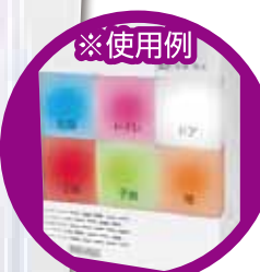
※受信時に 光るのは 1ヶ所です。