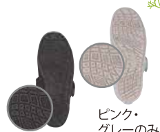
ピンク・グレーのみ