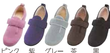
ピンク 紫 グレー 茶 黒