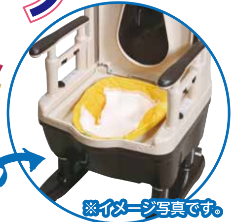
※イメージ写真です。