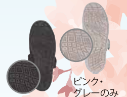
ピンク・グレーのみ