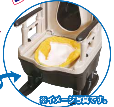
※イメージ写真です。