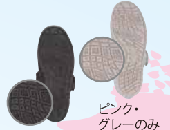
ピンク・グレーのみ