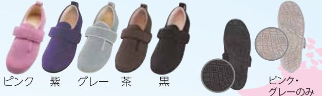
ピンク 紫 グレー 茶 黒