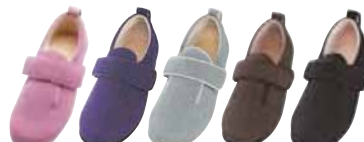
ピンク 紫 グレー 茶 黒