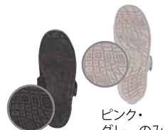
ピンク・グレーのみ